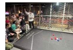
(サイバーボッチャ)

※ いきいきプラザとは、高齢者の相互交流・自主的活動・健康づくり等を促進する区有施設です。