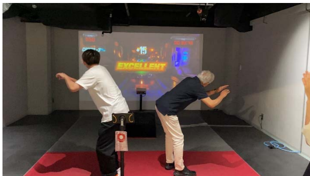
(大学生と高齢者で脱出アクションゲームをする様子)

※ いきいきプラザとは、高齢者の相互交流・自主的活動・健康づくり等を促進する区有施設です。