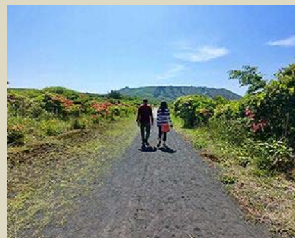
大島の中心に位置する標高758mの活火山、三原山。