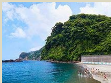
日の出浜海水浴場。お子様連れにも安心の静かなビーチ。

東京から一番近く、 高速ジェット船で 最短1時間45分で 行くことができる。 火山島ならではの地 形は別世界！ ハイキングやサイクリ ングがオススメ。