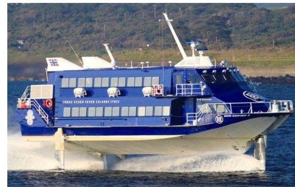
高速ジェット船のみなと区民号。竹芝客船ターミナルから最短1時間45分で到着！