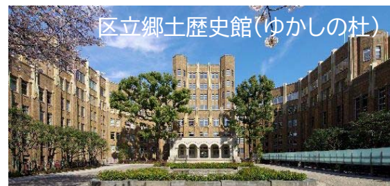
区立郷土歴史館(ゆかしの杜)