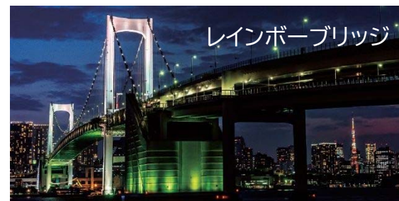
レインボーブリッジ

「ミナ得レシートキャンペーン」への参加を誘導し、区内での消費の活性化を図ります！