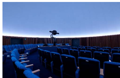
みなと科学館「プラネタリウムホール」

5月1日(月)～5月31日(水) 対象:0歳から高校生代の在住・在学の子ども とその保護者等は無料 みなと科学館 郷土歴史館 港区スポーツセンター 氷川武道場 学校屋内プール開放