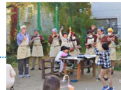
子育てひろば「あい・ぽーと」活動場面