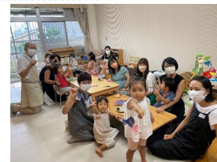
上:子育て・まちづくり支援プロデューサー工作の活動、下:パパサロン

日時:5月1日(月) 午前11時～11時30分 場所:子育てひろば「あい・ぽーと」ひろば