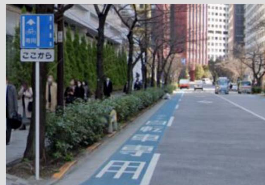
例) 自転車専用通行帯の設置