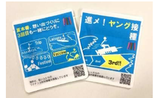
啓発品の例(コーヒー)