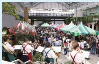
例 アークヒルズのヒルズマルシェ