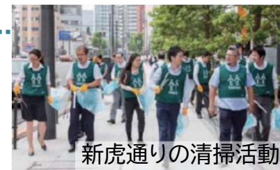
新虎通りの清掃活動