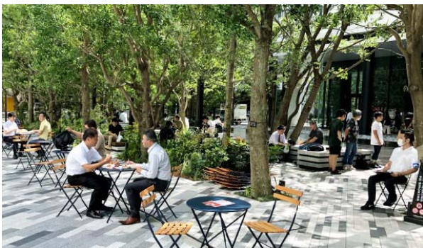
▲竹芝エリアマネジメントの道路利活用事例

公共的空間の利活用に関する基準や留意事項などを示す「港区エリアマネジメントガイドライン」の素案を決定