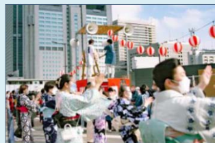
例 高輪地区まつり