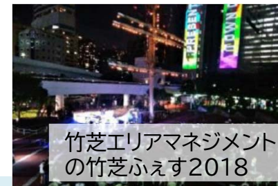
竹芝エリアマネジメントの竹芝ふえす2018