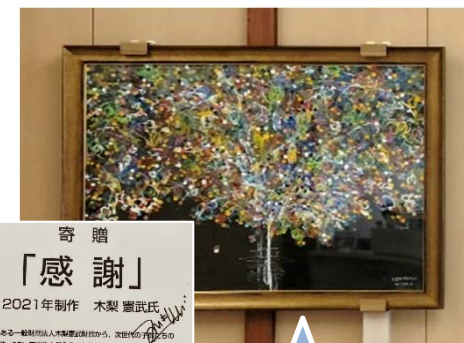
1階に、(一財)木梨憲武財団から区へ寄贈された原画「感謝」を展示しています。