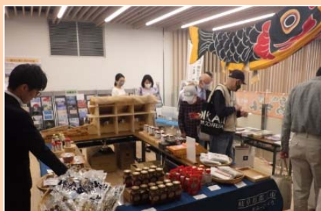
【3階】「港区と全国をつなぐコーナー」での郡上市の物産展の様子(令和5年5月10日開催)

「産業振興センター」、「三田図書館」、「民間連携床」からなる複合施設(令和4年4月オープン)