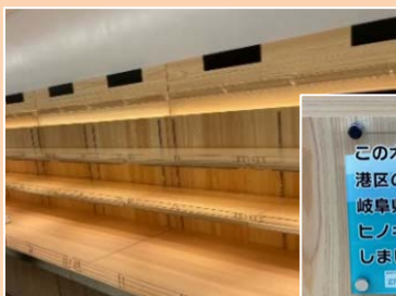
【2階】連携自治体(郡上市)の木材を使用した棚