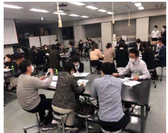
令和4年度の様子(感染症対応に関するグループワーク)