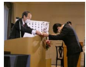
令和4年度表彰式の様子