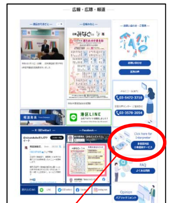
ホームページ画面