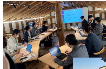
令和5年度実施の様子