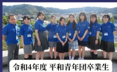
令和4年度 平和青年団卒業生