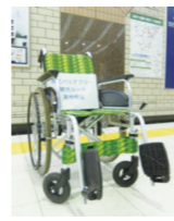
実地検証に使用した車いすの一例

本マップは、港区内の人気観光スポットをつなぐ定番15コースを紹介しています。本マップを作成するにあたり、車いすによる実地検証を行いました。各施設の観光情報、バリアフリー情報に加え、移動経路上のバリアフリー情報や移動のポイントなどを実際の写真を掲載し、地図上にわかりやすく表示しています。お示ししたコースの所要時間や移動時間は、お出かけになる方の体の状態や体調、車いすが手動か電動かなど規格によって変わりますので、参考情報としてご利用ください。また、各コースとも車いすでの自走や制動が難しく介助者が必要とする場合があります(本マップは介助者の同行を前提に作成しております)。コースのまわり方は1つの例ですので、気分や季節に合わせてコースを変えてお楽しみください。