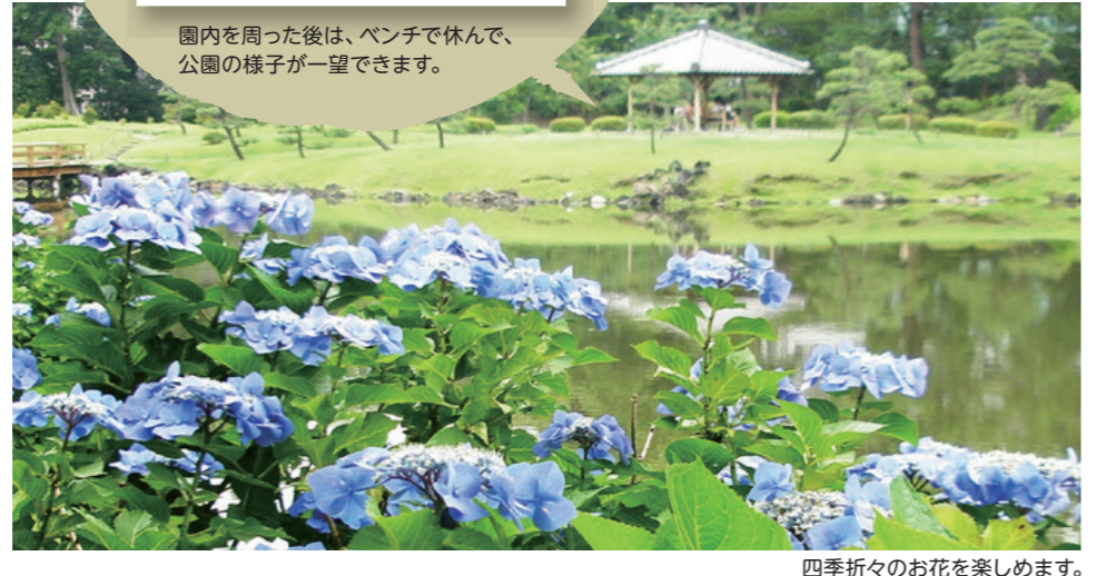
四季折々のお花を楽しめます。