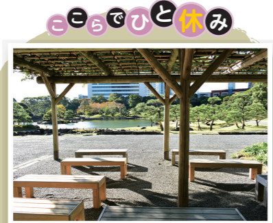
園内を周った後は、ベンチで休んで、公園の様子が一望できます。

日本庭園を眺め花を愛でる 江戸初期の大名庭園の面影を今に伝える名園の一つ。回遊式泉水庭園の特徴をよくあらわした庭園で、大泉水を中心とした地割りや石組の配置が非常に優れ、国の「名勝」に指定されています。 ☎03-3434-4029 9:00～17:00 (16:30閉門) ●一般150円、65歳以上70円(小学生以下及び都内在住・在学の中学生は無料) 身体障害者手帳、愛の手帳、精神障害者保健福祉手帳または療育手帳持参の方と付添の方は無料。