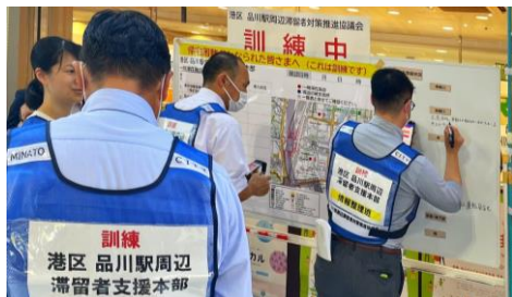
帰宅困難者対策訓練