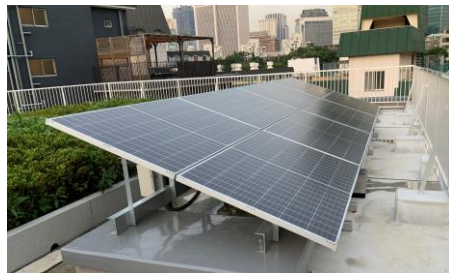
再生可能エネルギーの導入拡大