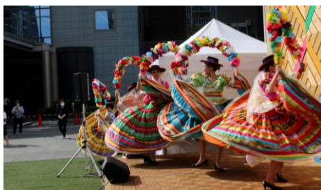
Minato Blossom Festa