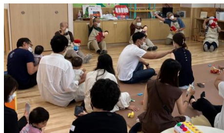
子育てひろばでのイベント