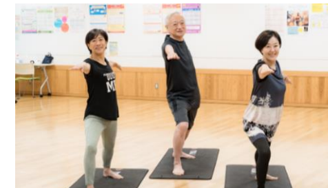
介護予防のためのヨガ教室