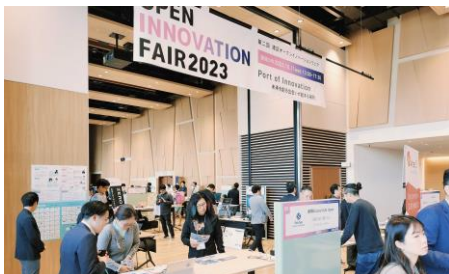
オープンイノベーションフェア