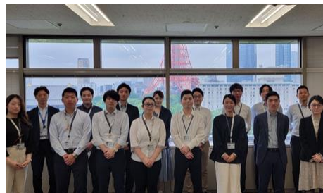
DX推進リーダーの育成