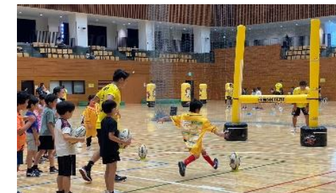
プロスポーツチームによるラグビー体験教室