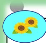
保育園であそぼう

幼児クラスでは全てのクラスでカタツムリを飼育しています。お世話をするのも自分たちで、霧吹きをもって「お水あげるの！」と可愛がっています。