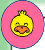
あひる組(1歳クラス)