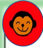
さる・ぱんだ組(4歳クラス)

あひる組の部屋に入ってすぐの場所で飼育しています。登園したときに「ちょうちょ！」と目を輝かせて毎日虫かごを覗いています。成虫になったらみんなで「ばいばい！」と手をふってお別れしています。