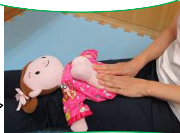
足を畳んだり伸ばしたり