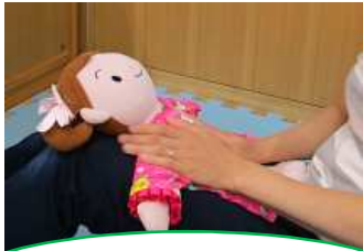
ゴシゴシ洗うように