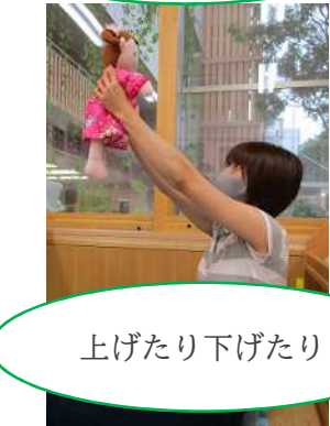
上げたり下げたり