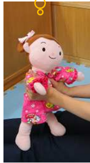
ギュッと抱きしめる