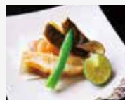
6. Agemomo Fried dish 油炸类菜 아게모모 (튀김) 揚げ物