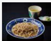
8. Oshokuji Soba or rice dish 主食 오쇼쿠지 食事