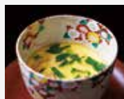
5. Mushimono Steamed dish 蒸菜 무시모노 (찜) 蒸し物