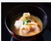
7. Nimono Simmered dish 煮菜 니모노 (조림) 煮物