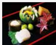
2. Zensai Appetizer 前菜 젠새 前菜