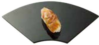
Nigiri 手握 니기리 握り

Raw, vinegared, soy marinated, boiled, or other toppings are pressed onto rice shaped into a boat by hand. The photo shows boiled clam with sauce.