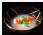
3. Owan Soup 汤类 오완 (국) お椀