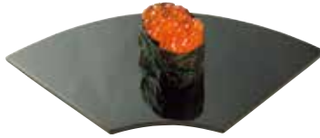
Gunkanmaki 军舰卷 군간마키 軍艦巻き

生のほか、酢締め、醤油漬け(ツケ)、煮あげなどのネタを手で船形にぎったシャリにのせる。写真は、煮切りを塗った煮はまぐり。