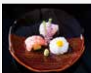
4. Otsukuri Sashimi 生鱼片 오츠크리 (생선회) お造り