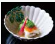
1. Sakizuke Starter 开胃菜 사키즈케 (식전 요리) 先付

ぜひお座敷で料亭体験をお楽しみください。床に座ることが難しい方には、イスとテーブルをご用意することもできます。加賀の伝統的な会席料理と室内のしつらえを堪能しながら、芸者を呼んで踊りや唄を体験し、日本文化を満喫してください。