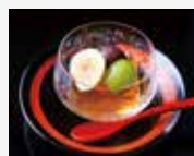
9. Kanmi Desert 甜点 디저트 甜味