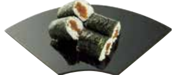
Norimaki 海苔卷 노리마키 海苔巻き

Rice and a filling are placed on seaweed and rolled up. Filled with kanpyo (sweet simmered gourd: photo), cucumber, or tuna, for example.