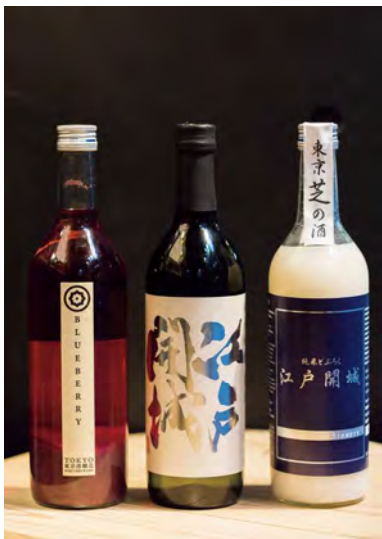
Left: Blueberry liqueur Center: Edo Kaijo refined sake Right: Edo Kaijo doburoku