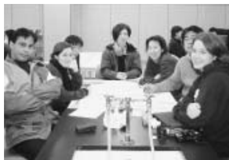
▲ユース意見交換会

外国人のための日本語初級講座 中国語初級講座 スペイン語初級講座 通訳ボランティア養成講座 「ブラッシュアップ」イングリッシュ 外国の人と日本語で話す会「レッツ・チャット・イン・ジャパニーズ」 英語による日本発見の会「レッツ・リディスカバー・ジャパン」