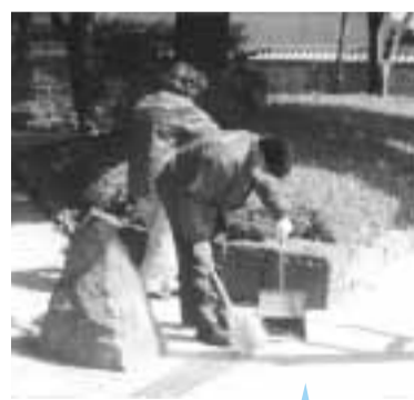
町会の皆さんの活動

地域環境美化活動(清掃活動など)を区内で定期的に行っている皆さんに、環境美化推進員を募集しています。 環境美化推進員に委嘱されると、清掃用具やジャンパーの貸与、保険の加入などが受けられます。