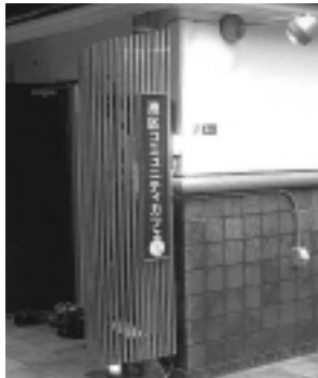
コミュニティカフェ入口