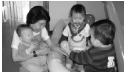
活動中の保育ボランティア あいている時間を「あい・ぽーと」で過ごすことが多くなりました。子どもの声を聞いて私が癒されることはもちろんですが、ここに集まる保護者の皆さんと顔の見える関係ができたこともうれしいことです。もっと役に立てたいと思っています。

とき 12月22日(月)午後2時 曲目 クリスマスメドレー、さんぽ(となりのトトロ)、いつも何度でも千と千尋の神隠し(等) ソプラノ・ヴァイオリン・ピアノの演奏です。みんなで合唱もします。 費用 1家族500円