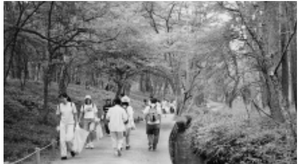
日帰り健康バスハイキング「日光・戦場ヶ原」