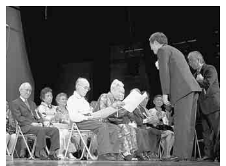
▲区长からお一人ずつに

現状です。区では、9月18日(土)に赤坂区民センターで8020達成者表彰式を行いました。