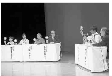
▲歯の健康フォーラムの様子