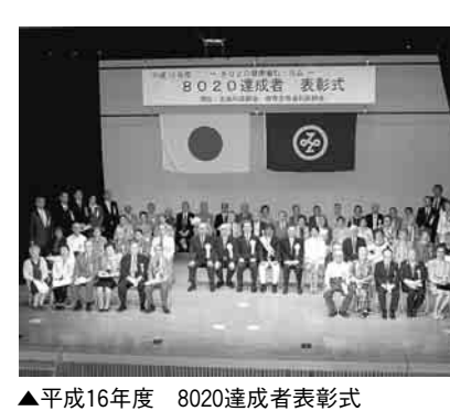
▲平成16年度 8020達成者表彰式

8020達成の秘けつ 達成者の皆さんの特徴として、およそ8割の人が「かかりつけ歯科医」を決めていて、そのほとんどの人が、かかりつけ歯科医で治療以外に定期健診や歯石除去等の予防的処置を受けています。