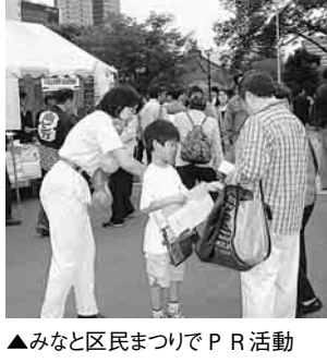
▲みなと区民まつりでPR活動

9月18日(土)に開催した「健康秋祭り」で発表と表彰式を行いました。今後、健康づくりに