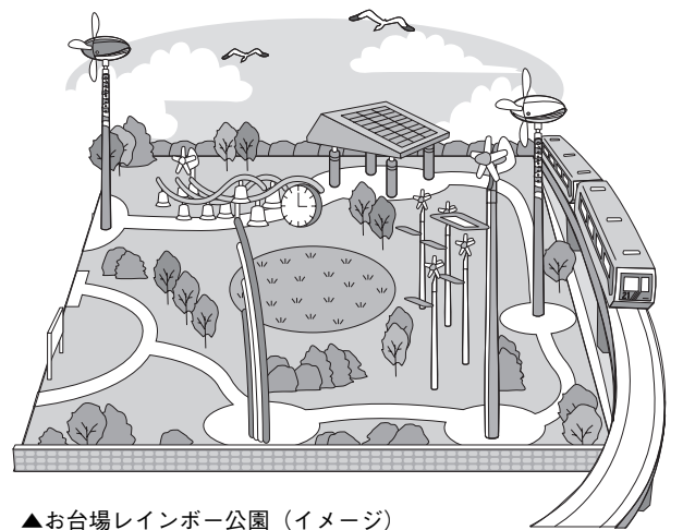
▲お台場レインボー公園 (イメージ)

また、地域の皆さんの意見を参考にしながら、屋根に太陽光発電機と星座図がついた東屋、自然エネルギーで鐘を鳴らして時間を知らせるカリヨンベルなども設置しました。楽しんで、環