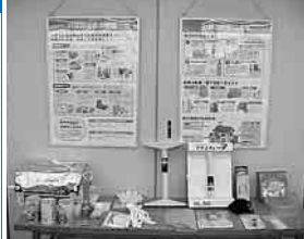
▲防災課(区役所5階)では、家具の転倒防止器具や非常持ち出し品などの防災用品の展示を行っています。

迫死と思われる死者が、8割を超えていました。 寝室には、家具を置かないことや家具の配置を変更する、家具の転倒防止措置を実施するなどの対策が必要です。 皆さんも、もう一度、家の中の安全対策を確認してください。 防災についてのパンフレットや、広域避難場所・避難所を掲載した防災地図などは、防災課のほか各支所にもありますので、ご利用ください。