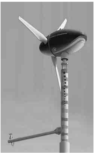
▲風力発電機「にじのくじら号」

また、地域の皆さんの意見を参考にしながら、屋根に太陽光発電機と星座図がついた東屋、自然エネルギーで鐘を鳴らして時間を知らせるカリヨンベルなども設置しました。楽しんで、環