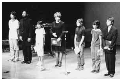
▲NPOとの連携により開催した「港区平和都市宣言記念朗読会」の様子(平成16年8月)

港区平和都市宣言20周年にあたり、各種平和事業を区と連携し実施していただける平和団体等を募集します。詳しくは、3月31日(木)までにお問い合わせください。