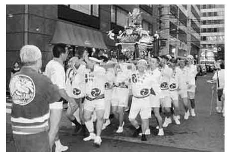
▲にぎやかなおまつり(芝地区)

④参加希望者は、町会・自治会の代表者へ連絡します。または、町会・自治会の代表者から、参加希望者へ連絡します。