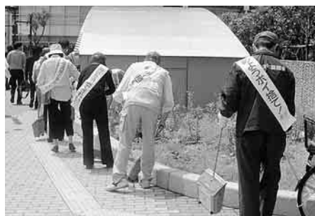
▲田町駅周辺の美化キャンペーン(芝浦港南地区)