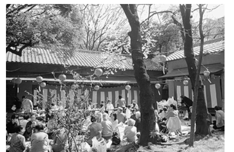
▲地域でお花見(赤坂地区)

現在、区には230団体を超える町会・自治会があります。町会・自治会は、地域の皆さんが自主的に組織し運営する団体です。港区を安全で安心して暮らせるまちにするため、地域の連帯感を強めるという面で、非常に重要な役割を担っています。