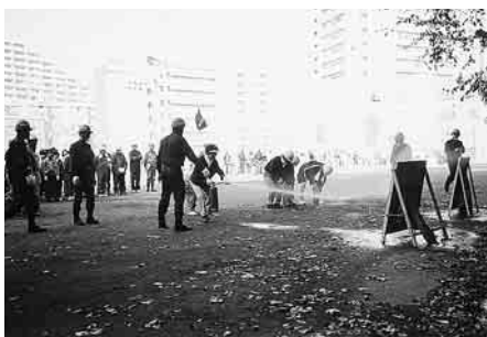
▲地域での防災訓練(高輪地区)