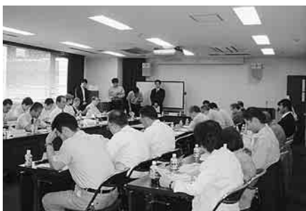
▲麻布地区の生活安全と環境を守る協議会の開催(麻布地区)

現在、区には230団体を超える町会・自治会があります。町会・自治会は、地域の皆さんが自主的に組織し運営する団体です。港区を安全で安心して暮らせるまちにするため、地域の連帯感を強めるという面で、非常に重要な役割を担っています。