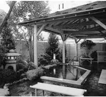
▲湯沢ニューオータニホテル

になりますので、ご注意ください。 抽せん結果は、月末に、ご自宅に郵送します。届かない場合は、JTBみなと予約センターまでご連絡ください。 空き室申し込み 利用希望日の1カ月前の同日から(例・12月25日に宿泊を希望する場合は、11月25日から)