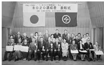
▲平成17年度8020達成者表彰式

10月29日(土)、高輪区民センターで、今年度の8020達成者表彰式を行いました。達成者は28人でした。達成者約9割がかかりつけ