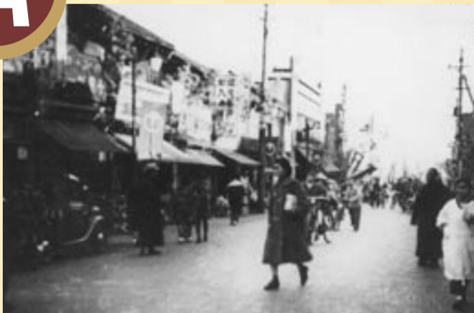
江戸時代、この辺りの川の地形が荷揚げ場を作るのに適していたため商品の集積場となり、次第に商業が活性化していきました。1941(昭和16)年の写真です。