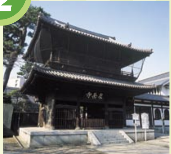
1612(慶長17)年に門庵宗閔和尚(今川義元の孫)が開山した寺院です。浅野内匠頭、大石内蔵助など四十七士の墓があることで有名です。義士祭(毎年4月・12月)には多くの人でにぎわいます。