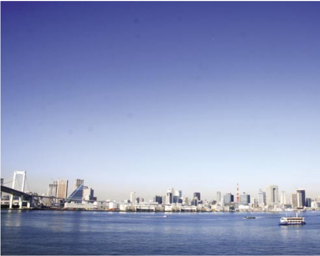
レインボーブリッジ ノースルート台場側から