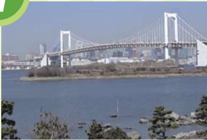
平成8年の臨海副都心開発によりお台場に新しいまちが誕生しました。現在は約5,000人の区民が住んでいる一方で、レジャーや観光スポットとして全国から注目を浴びる存在にもなっています。