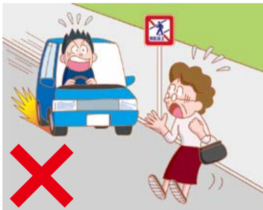
横断禁止場所で渡ってはいけません。遠回りでも横断歩道を渡りましょう。