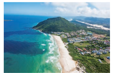
ブラジル写真展より