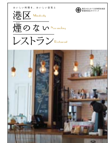
登録飲食店を地図や写真で分かりやすく紹介したガイドブックです

区内の飲食店で禁煙・分煙に取り組む、「みたとタバコ対策優良施設」に登録した飲食店を紹介しています。ガイドブックは、みたと保健所、各総合支所等で配布しています。