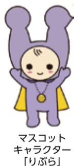
マスコットキャラクター「りぶら」

問い合わせ 男女平等参画センター ☎3456-4149 メールアドレス libra@career-rise.co.jp