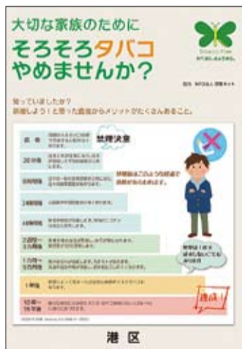
禁煙方法が分かるリーフレットを港区ホームページからダウンロードできます