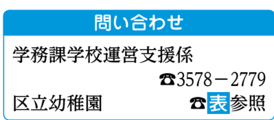
表 区立幼稚園のイベント一覧

のイベントを行います。内容は、人形劇やコンサート、バザー、縁日等です。皆様のご参加をお待ちしています。