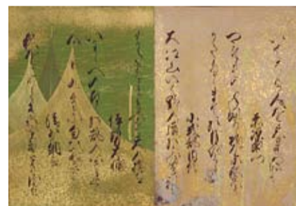
百人一首帖 智仁親王筆 1帖 彩箋墨書 日本・江戸時代 17世紀 根津美術館蔵