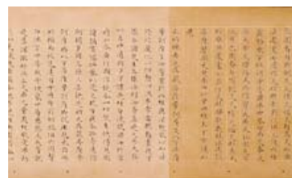
国宝 無量義経 1巻 彩箋墨書 日本・平安時代 11世紀 根津美術館蔵