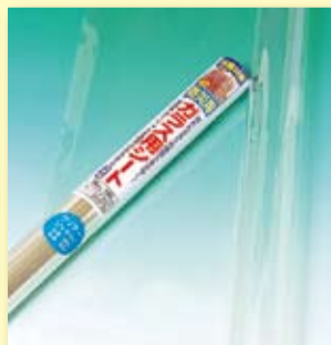
ガラス飛散防止フィルム

区では、港区内に住民登録している世帯に対して、各世帯1回に限り、家具転倒防止器具等を無償で助成しています。今後、従来の器具とは異なる機能を持った器具を導入します。また、高齢者のみの世帯や、障害者を含む世帯には、助成を受けた器具等を無償で取り付けています。平成29年度からは、新たに妊産婦を含む世帯やひとり親家庭を取り付け対象に追加しています。