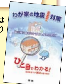
器具の取り付け方等に関するパンフレット