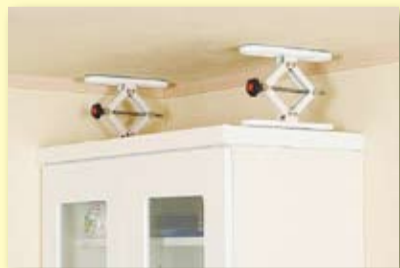
家具転倒防止器具「ふんばりくんZ」