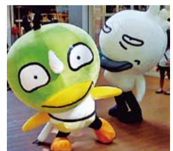
悪質商法被害防止キャンペーンキャラクター「カモかも」(左)、「サギだもん」(右)