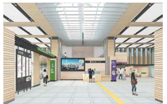
正面玄関エントランスホールのイメージ