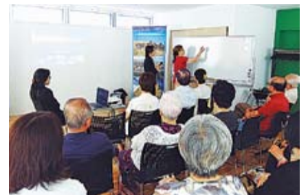
平成28年7月のウルグアイ大使夫人の公演

ところ 高輪区民協働スペース 費用 無料 次回開催日(花見会) 3月28日(火) 午後1時30分～4時 コミュニティ・カフェ高輪 対象 どなたでも とき 毎月第2・4金曜午後1時30分～4時 ところ 高輪区民センター2階展示ギャラリー前 費用 無料