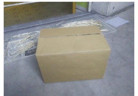
製紙工場へ送ります