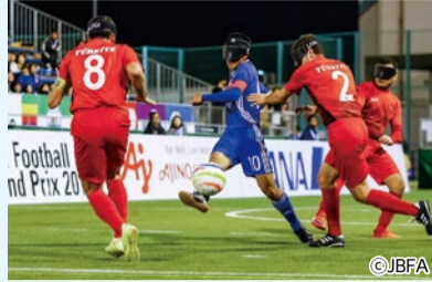
ドリブル突破からゴールを狙う選手

ルールはサッカーやフットサル(5人制サッカー)とほぼ同じですが、いくつか独自に設けられたものがあります。国際ルールの試合時間は、前後半20分ハーフです。フィールドプレーヤーは全選手が公平な条件でプレーできるよう視覚を閉じるアイマスクを着用し、転がると「シャカシャカ」と音が鳴るボールを奪い合います。ゴールはフットサル(縦2メートル、横3メートル)より大きい、縦2.14メートル、横3.66メートルです。ピッチの両サイド