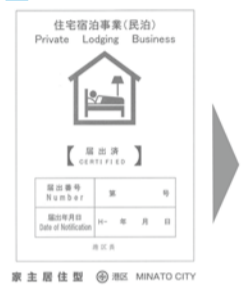
標識の掲示イメージ

事業を行おうとする者は、届出をしようとする14日前までに、近隣住民に対して書面で周知を行います。近隣で住宅宿泊事業が行われることを事業開始前に周知することで、事業への理解を得るとともに、もめ事が起こることを未然に防ぐこ