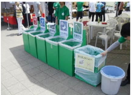
割りばしを回収して