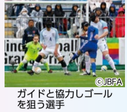
ガイドと協力しゴールを狙う選手