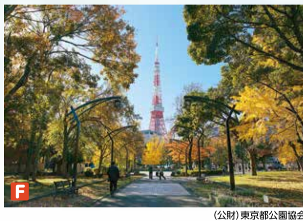
(公財)東京都公園協会