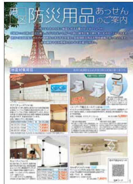
防災用品あっせんパンフレット