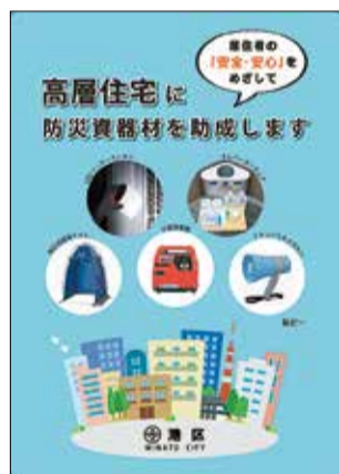
パンフレット表紙

区では6階以上かつ50戸以上の高層住宅に対して、防災資器材を助成しています。詳しくはパンフレットをご覧ください。パンフレットは各総合支所協働推進課窓口で配布している他、港区ホームページでもご覧いただけます。