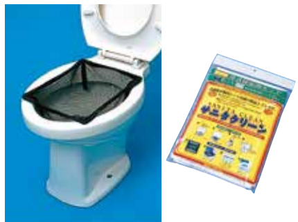
サニタクリーン・洋式便器用

※聴覚障害3級以上の人のみ (9) 聴覚障害者用クリーナー付き補聴器用バッテリーチェッカー ※聴覚障害3級以上の人のみ