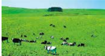
大規模草地の牛たち

北海道の宗谷地域北部、日本海に面した豊富町は、酪農が盛んな自然豊かな町です。町内には、ラムサール条約(湿地の保存に関する国際条約)に登録され、花と野生動物の宝庫のサロベツ湿原があります。