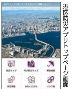
港区防災アプリトップページ画面

「港区マンション震災対策ハンドブック」や「わが家の地震家具転倒防止対策」等、パンフレットの内容をPDFファイルで表示します。