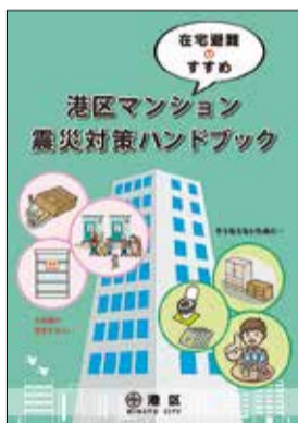
ハンドブック表紙

区では、高層住宅の管理者や居住者の皆さんからご意見をいただくとともに、有識者やマンション防災関係者等による検討会を設置し、作成した「マンション震災対策ハンドブック～在宅避難のすすめ～」を無料で配布しています。このハンドブックを活用して、今すぐ防災対策に取り組みましょう。