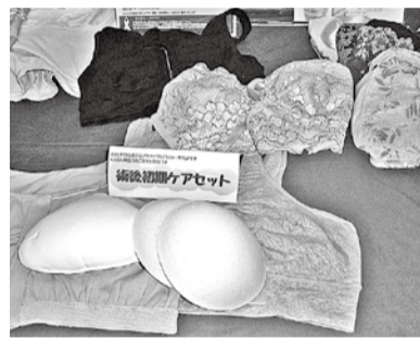
胸部補整下着の一例

●補助対象者1人につき1回限りです。ウィッグのみではなく、胸部補整具も購入した、ウィッグを複数購