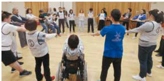
平成30年度のソーシャルサーカスワークショップの様子

二次元コードをスマートフォンで読み取ると、ソーシャルサーカスに関する参考映像をご覧いただけます。