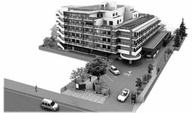
図 特別養護老人ホーム「南麻布シニアガーデン アリス」開設予定地