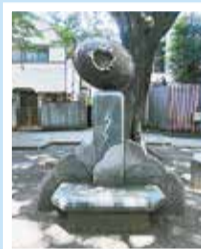
雷神誕生の碑 (雷神山児童遊園)

白金北里通りに出て、白金の丘学園を過ぎると、白金六丁目にある雷神山児童遊園に入る路地があります。この地には、平安時代に疫病が流行した際、それを鎮めるために雷神を祭った雷神社が建てられました。以来、ここは雷神山と呼ばれ、雷神社は戦後に氷川神社に合祀され、雷神山は児童遊園に生まれ変わりました。雷神誕生の碑がある園内は、木々に囲まれ、都心とは思えない静かな場所です。春にはソメイヨシノが満開になる桜の名所でもあります。