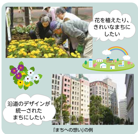
「まちへの想い」の例