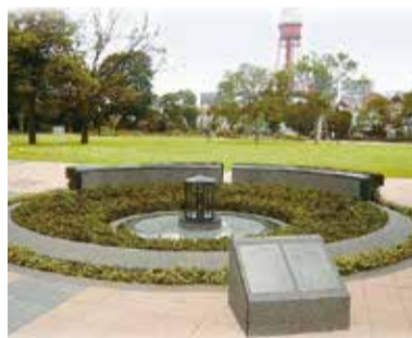
区立芝公園で灯し続けている「平和の灯」

区は「平和の灯」を、平成17年度に、港区平和都市宣言20周年の記念事業の一環として、核兵器の廃絶と世界の恒久平和を願い区立芝公園に設置しました。平和の灯にともされた「火」は、広島市の「平和の灯(ともしび)」、福岡県八女市(旧星野村)の「平和の火」、長崎市の「ナガサキ誓いの火」を合わせたものです。区は、「平和の灯」を通じて、戦争の惨禍と平和の尊さを伝えていきます。