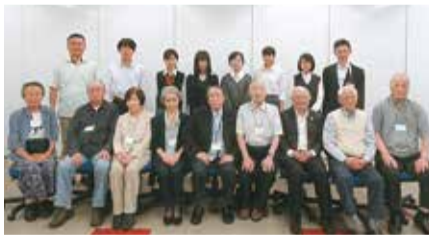
戦争体験者の皆さんと港区平和青年団

令和元年度は、公募で選ばれた6人の高校生が、長崎への派遣研修や戦争体験者との交流会を通じて平和について学びます。学習した成果は、8月24日(土)開催の「平和のつどい」で報告します。 ※団員は、毎年度4月に募集しています。