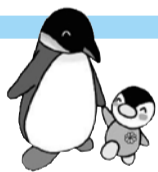
東京都民生委員・児童委員キャラクター「ミンジー」

民生委員・児童委員協議会が、子育て支援事業として活動している「たんぽぽクラブ」は、乳幼児～4歳くらいまでのお子さんと保護者が友達を作って、自由に遊べる