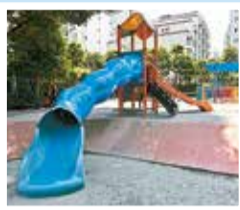
白金一丁目児童遊園

目黒通り沿いにある白金台いきいきプラザのサイクルポートで自転車を借りましょう。目黒通りから白金二丁目と四丁目の住宅街を通る三光坂を下り、白金一丁目児童遊園に寄ります。トンネル型の滑り台等の遊具がある公園は、子どもたちに人気です。次に古川沿いにある白金公園に向かいましょう。園内には古川の水辺に近づけるように設置