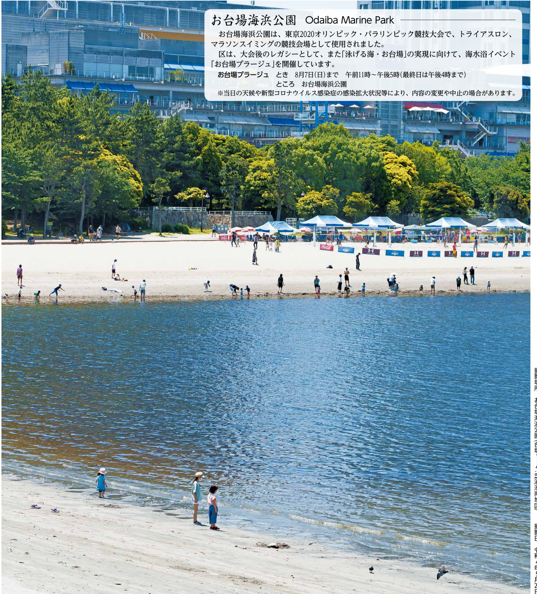
撮影場所 お台場海浜公園(台場1-4:芝浦港南地区) 撮影日 令和4年5月29日

※当日の天候や新型コロナウイルス感染症の感染拡大状況等により、内容の変更や中止の場合があります。