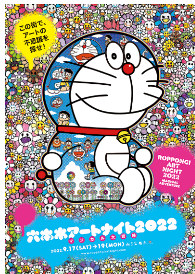
©2022 Takashi Murakami/Kaikai Kiki Co., Ltd. AllRights Reserved. ©MADSAKI/Kaikai Kiki Co., Ltd. AllRights Reserved. ©Fujiko-Pro