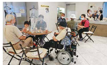
コミュニティ・カフェ高輪の様子