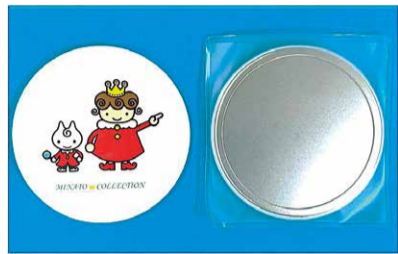
スタンプ3個でハンドミラー