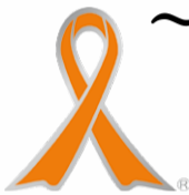
オレンジリボンは児童虐待防止のシンボルです。

11月は「児童虐待防止推進月間」です ～「もしかして？」ためらわないで！ 189(いちはやく)～