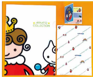
スタンプ6個でクリアファイルと付箋セット