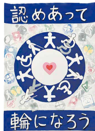
最優秀賞作品 金谷 朱見子さん(一般)