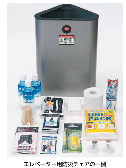
エレベーター用防災チェアの一例