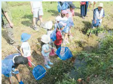
水生生物観察の様子(環境学習の一例)