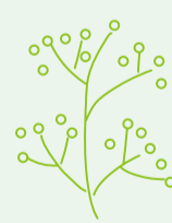
施設の様子放課後等デイサービス

専門的見地からお子さんの課題に応じた個別支援および小集団の支援を行います。生活能力の向上および社会性やコミュニケーションスキルを伸ばすことをめざします。