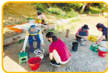
火おこし体験の様子