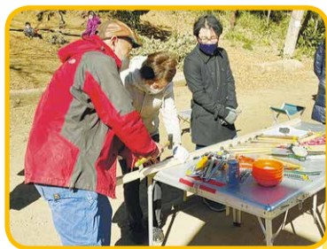
のこぎりを使っている様子