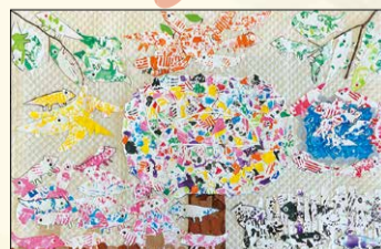
すてっばわん 「すてっばわんの56びきのカメレオン」