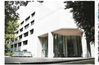
東京都立中央図書館外観