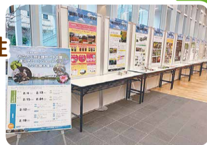
パネル展の様子(みなとパーク芝浦)