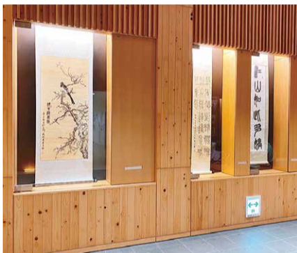
高齢者の書画作品

中国北京市朝陽区との友好交流事業として始まった書画交流展を令和5年度も開催します。毎年好評いただいている高齢者と子どもたちの作品は、今年も力強く、躍動感ある書、豊かな色彩感覚で描かれた絵画等、どれも魅力的なものばかりです。素晴らしい力作の数々を、どうぞ鑑賞ください。