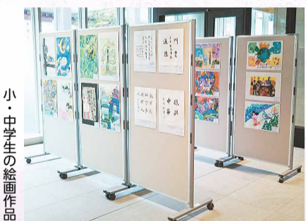
小・中学生の絵画作品