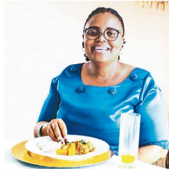
ランチを楽しむレソト王国大使