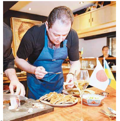
チキンキウイを調理するウクライナ大使