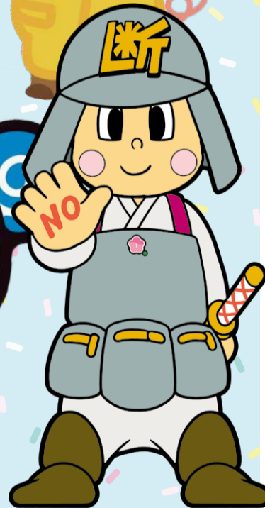
だんじろう(断辞郎)