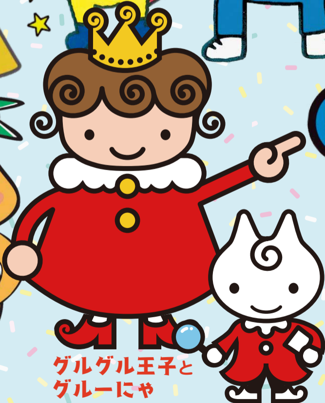
グルグル王子と グルーにや