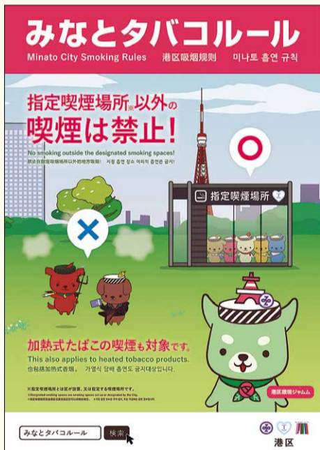
みなとタバコルール啓発ポスター