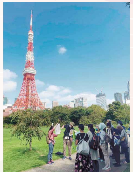
模擬ツアーの様子