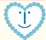
指定喫煙場所マーク