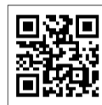
区長室公式アカウント

約20の公式アカウントが稼働中! 幅広い分野の区の最新情報を発信する区長室(広報・報道)アカウントに加え、各部署のアカウントをフォローすることで、各分野の情報をタイムリーに受け取ることができます。区が運用しているアカウントの一覧は、港区📄をご覧ください。