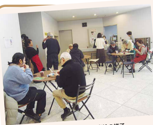
コミュニティ・カフェ高輪の様子