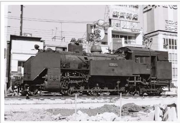
新橋駅西口広場に設置中の C11 形蒸気機関車（昭和 47 年）

明治5年（1872）に日本初の鉄道が新橋～横浜間に開業してから100周年となる昭和47年、国鉄から港区にC11形蒸気機関車が貸し出され、鉄道発祥の地である新橋の駅前に設置されました。それから50年、今年（令和4年）は新橋～横浜間鉄道開業150周年に当たります。