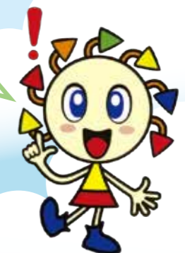
港区リサイクルキャラクター エコル